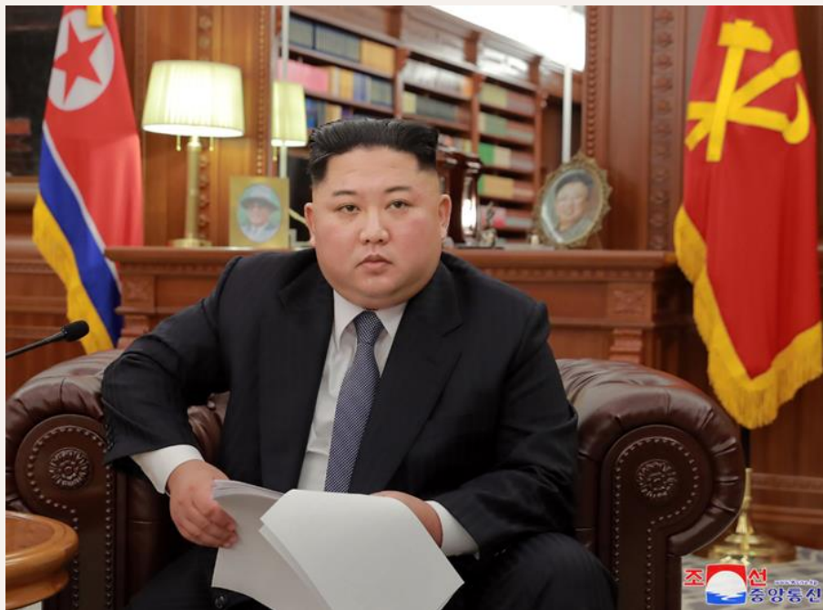
D.D.F. Koreas øverste leder Kim Jong Un

Følgende er den fulde tekst i nytårstalen Den Demokratiske Folkerepublik Koreas øverste leder Kim Jong Un holdt den 1. januar 2019: