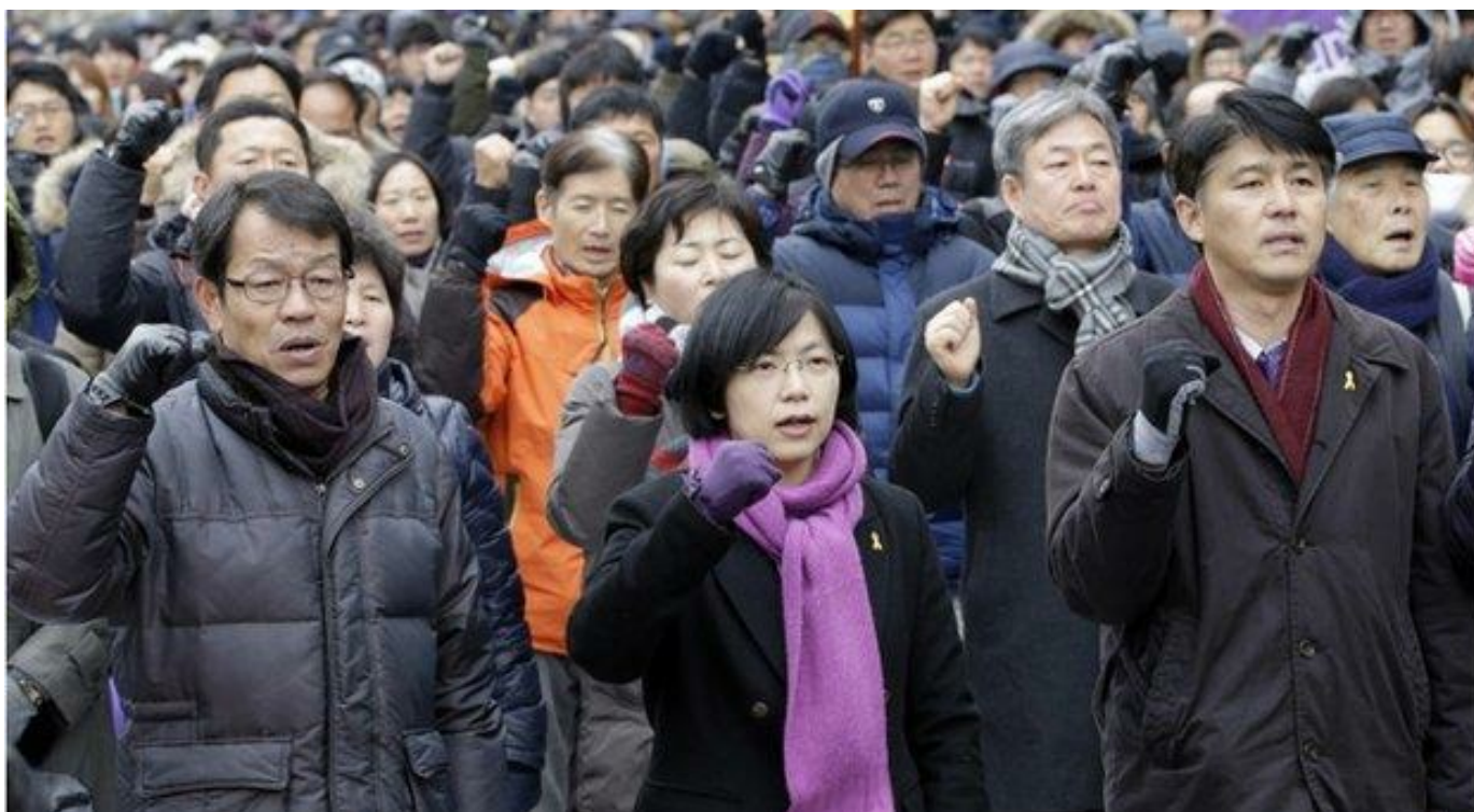
Fra protestdemonstration i går foran Sydkoreas forfatningsdomstol, der ulovliggjorde oppositionspartiet United Progressive Party