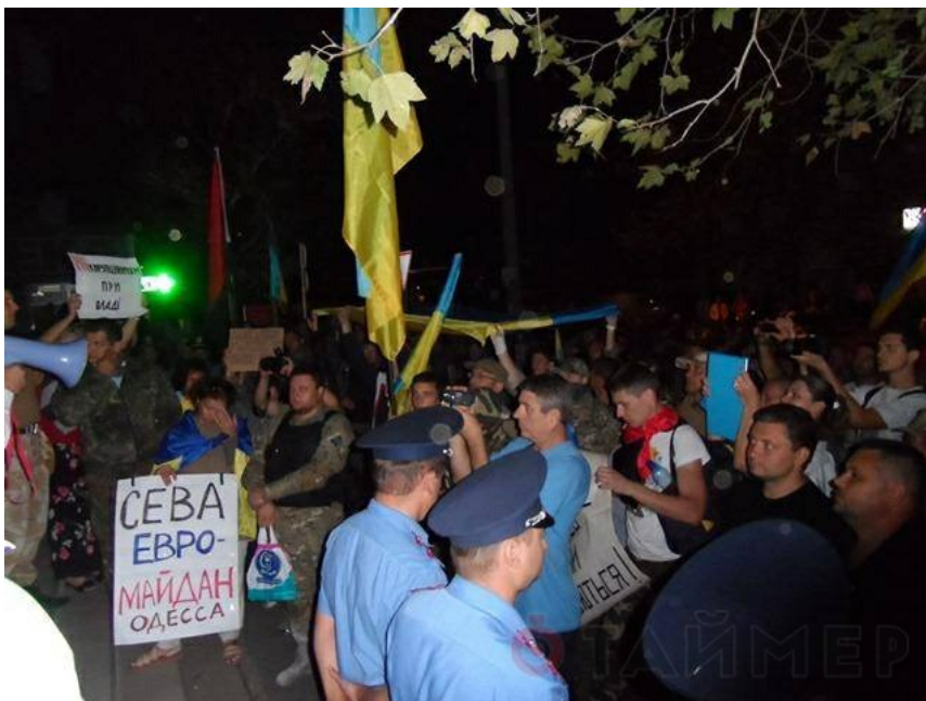
Fra internetsiden Solidarity with the Antifascist Resistance in Ukraine.

Hvis EU havde haft en udenrigspolitik og et kompetent embedsapparat, ville der have været formuleret nogle interesser fælles for EU-landene. Men det var ikke tilfældet, og da så EU's udenrigsminister Charlotte Ashton var inkompetent, var vejen åben for en udvikling, som truer EU som politisk projekt. Ashton støttede helt uhammet den nye regering. Hvorfor? Formentlig kunne EU-politikerne ikke aflæse situationen, at netop det at bryde den hårfine balance mellem de to halvdele i Ukraine ville føre til en katastrofe. Snart var det østukrainernes tur til at lave deres Maidan. Vesten havde jo accepteret oprør i Kiev og den vestlige del. Men da østukrainerne også ville bruge denne metode, kritiserede vesten stærkt ikke regeringen men dem som lavede oprør. På Krim, som overvejende er russisk, og hvor Rusland har lejet en flådebase flere årtier frem, var store dele af befolkningen i stigende grad utilfredse med tingenes tilstand i Kiev. I løbet af ca. en måned havde de foranstaltet en afstemning om løsrivelse fra Ukraine og senere tilslutning til Rusland. Ukraine var ved at gå op i limningen. Begivenhederne