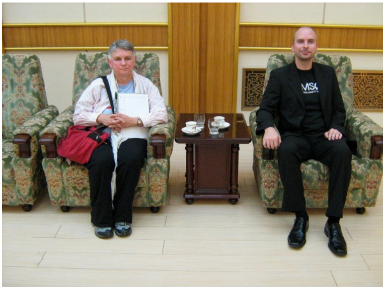
De ærede gæster venter

iværksat af Sydkorea og USA. Med hensyn til de mulige velstandsproblemer mente min modpart, at det ikke var aktuelt for Nordkoreas vedkommende. Jeg svarede, at det var rigtigt, men at hvis der skulle dæmmes op for disse problemer, så var det vigtigt at overveje dem, inden de stod midt i dem. Han tænkte lidt over det og svarede så, at de godt vidste, at der var alt for mange biler i Beijing, og at de ville betragte det, jeg havde sagt, som et kammeratligt råd. Vi talte endnu om mangt og meget, og så sagde vi pænt farvel i den kæmpemæssige sal, hvor mødet havde fundet sted.