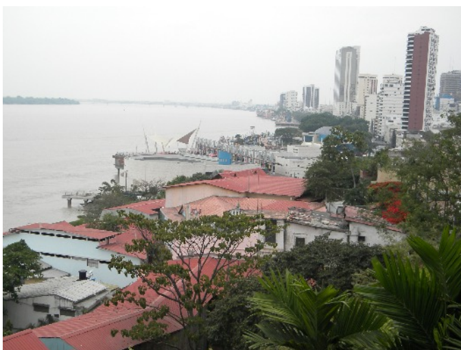
Guayaquil: Udsigt fra den gamle bydel på Ana-bjerget over Guayas-floden og den nye bydel, hvor Verdensmødet fandt sted.