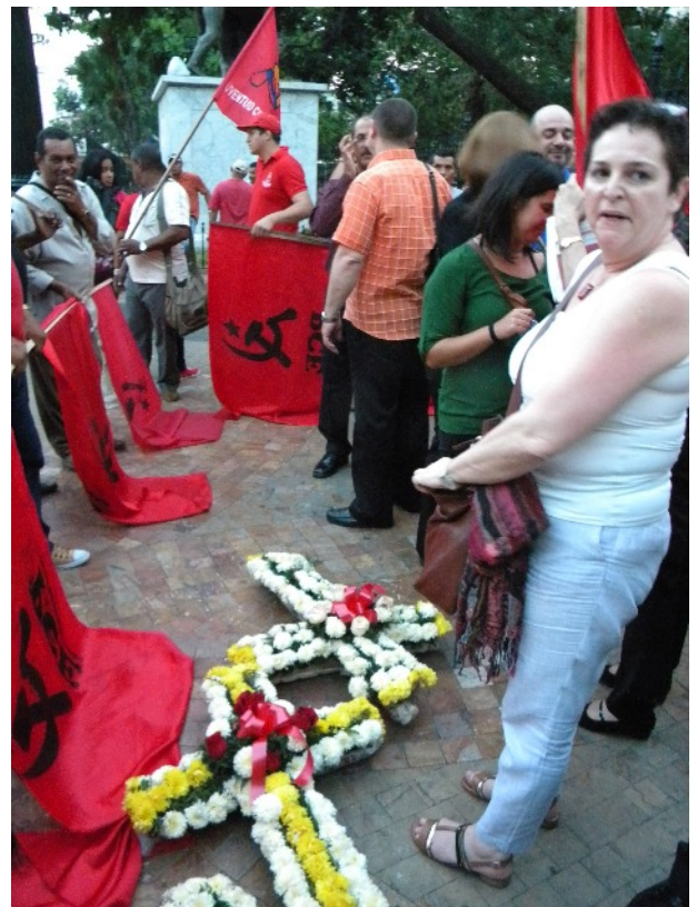
Den 15. november 1922 overfaldt politiet en arbejderdemonstration i Guayaquil; flere blev dræbt og ligene smidt i Guayas-floden. Hvert år på datoen for massakren holdes der en massedemonstration i Quayaquil, og til minde om de døde medfører demonstranterne kors, som kastes i floden. I år faldt minddedagen sammen med det Kommunistiske Verdensmøde, og de delegerede deltog i demonstrationen.