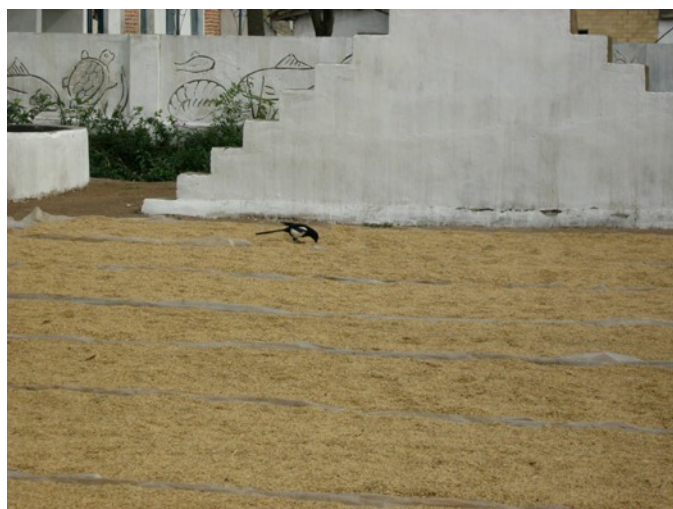
Korn tørres udendørs

Det er magtpåliggende for Nordkorea at være selvhjulpen – meget fornuftigt, når der hele tiden og når som helst er blokade af landet. Nordkoreanerne berettede med stolthed om de seneste landvindinger: der produceres nu sko nok til alle, og landet producerer nu selv CNC-maskiner. Nordkorea har en stor maskinindustri og mange metaller og sjældne jordarter. Det skyldes, at Nordkorea for 80% vedkommende består af bjerge,