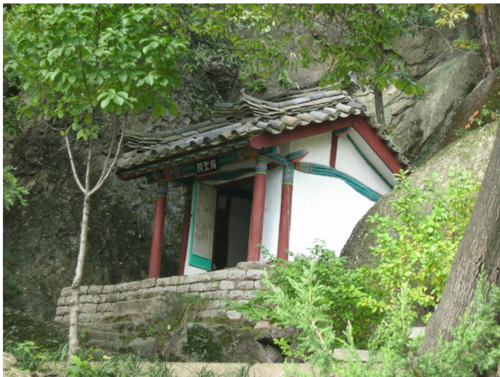
Det lille tempel på Dragebjerget

Én ting, jeg ikke brød mig om, var parolen om at sætte militæret først, bl.a. på grund af den betydning det har for den manglende kønsmæssige ligestilling. Til gengæld forstår jeg det godt i den situation, Nordkorea befinder sig i. Hvis ikke Nordkorea havde et stærkt militær, ville USA føle sig mere fristet til lige at gennemføre et regimeskifte. Og når vi ser på tilstandene i de lande, hvor socialismen afløses af kapitalisme, så er jeg med på at acceptere en militær dominans. Til gengæld gør soldaterne så en stor indsats i det civile liv, jf. deltagelse i høstarbejdet. Et andet eksempel fik vi, da vi var ude at se en kæmpemæssig æbleplantage, der var blevet anlagt uden for Pyong-Yang. Vi fik at vide, at det var sikkerhedsstyrkerne, der havde hjulpet med jordarbejderne og plantningen af de mange tusinder af æbletræer. Området havde tidligere været rismarker, og 2 landsbyer var blevet flyttet. Beboerne havde selvfølgelig