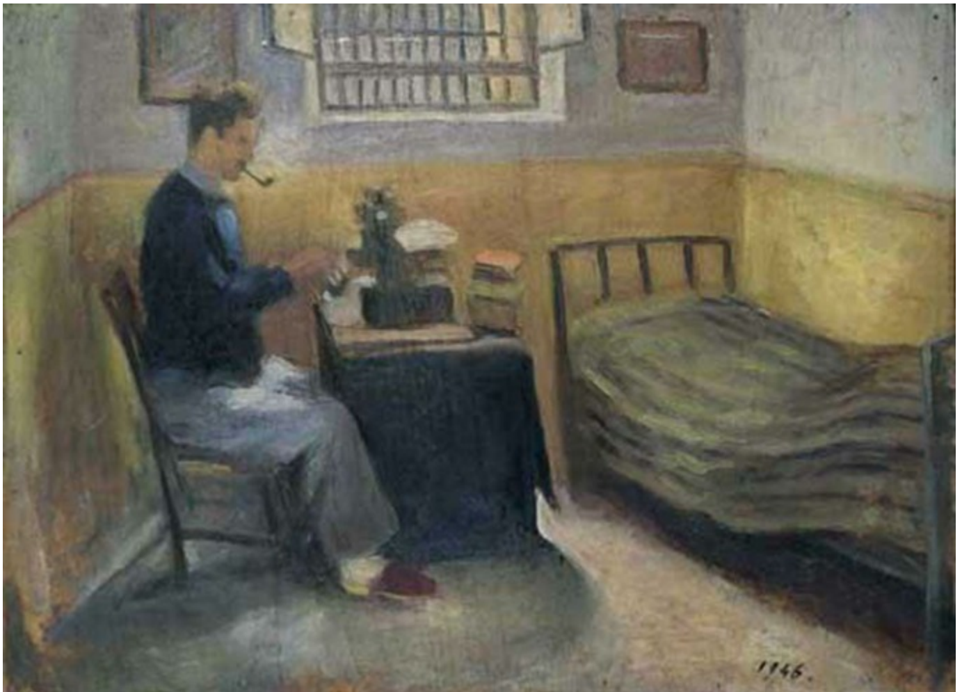
Selvportræt fra en af indespærringerne.