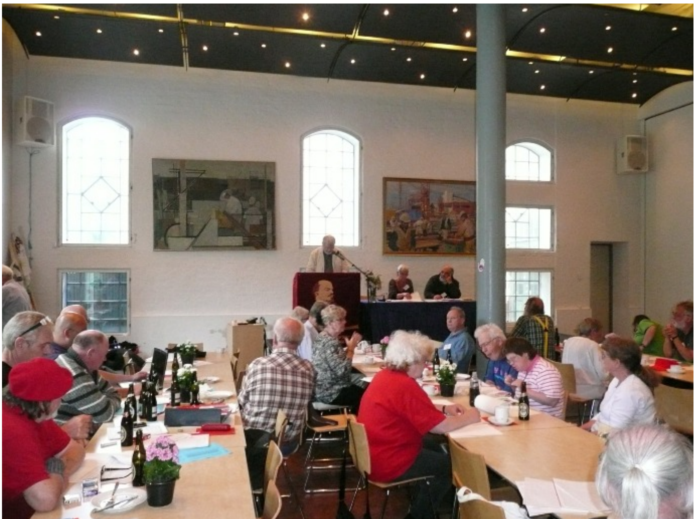
33. kongres blev holdt i BJMF-huset på Trekronergade i Valby, København.

Men genforening eller ej, så er vi nødt til at tage stilling til de to spørgsmål, vi rejser i den skriftlige beretning, og som jeg nu har forsøgt at sige lidt mere om. Nogle vil måske synes, at de to spørgsmål, om alliancemønstre i dansk politik og om socialismen på dagsordenen, at de ikke har meget med hinanden at gøre, men det har de. De er begge rejst af en verden i krise og