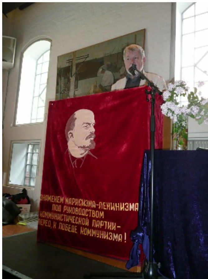
Banneret, der smykker talerstolen, er skænket af Dusja Carlsen. Teksten under Lenin-portrættet lyder: "Under marxismen-leninismens banner, under det kommunistiske partis ledelse – fremad mod kommunismens sejr!"

I morgen skal der være valg i Grækenland igen. Det græske valgsystem favoriserer det største parti. Meningen med det var,