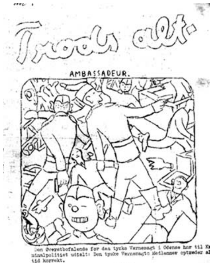
Det illegale Trods alt var eneste dagblad under folkestrejken i Odense.

Det at skabe en illegal organisation er et yderst vanskeligt arbejde som kræver stor indsigt i forholdene lokalt og en revolutionær tålmodighed, som det tager mange års erfaring at udvikle.