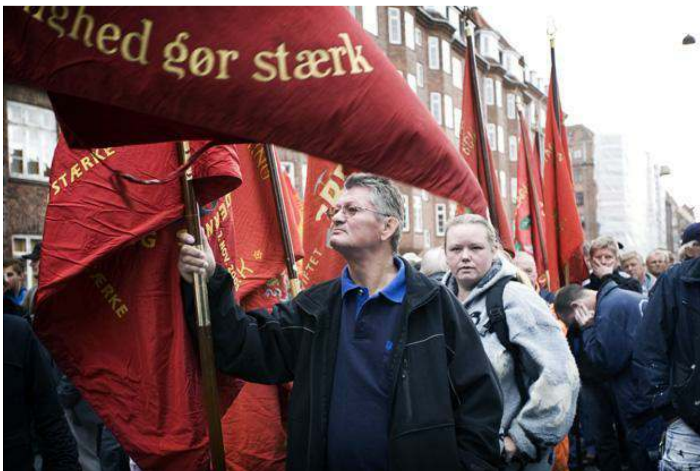
Protester mod det indgåede forlig.