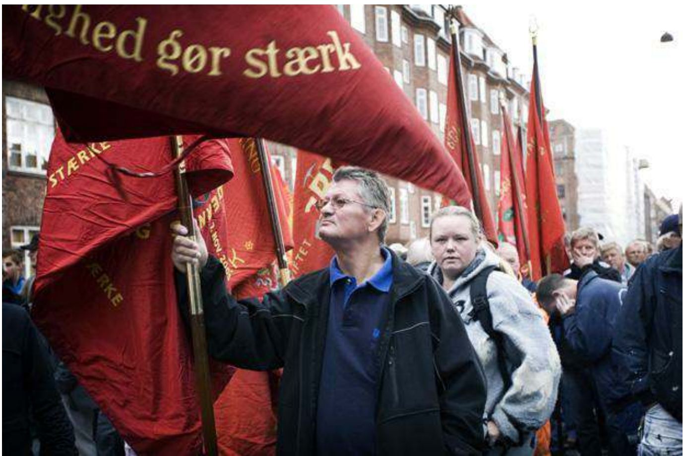
Protester mod det indgåede forlig.