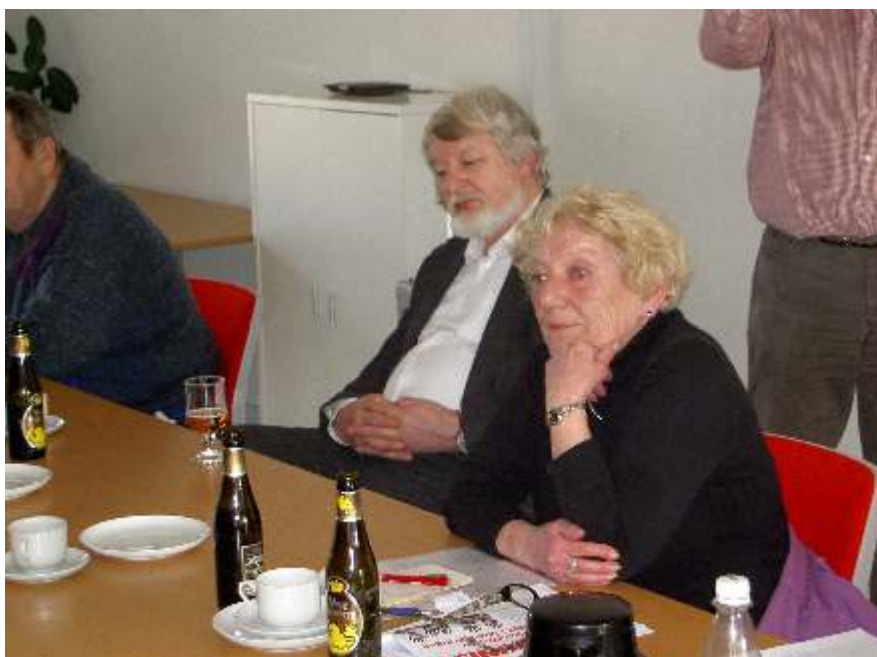
De to partiformænd til genforeningsdebatmøde i Ringsted.